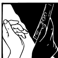
Grafik: Ildiko Zavrakidis

„Wenn du Almosen gibst, lass es nicht vor dir her posaunen, wie es die Heuchler in den Synagogen und auf den Gassen tun, um von den Leuten gelobt zu werden. Amen, ich sage euch: Sie haben ihren Lohn bereits erhalten. Wenn du Almosen gibst, soll deine linke Hand nicht wissen, was deine rechte tut, damit dein Almosen im Verborgenen bleibt; und dein Vater, der auch das Verborgene sieht, wird es dir vergelten.“ Matthäus 6, 2–4