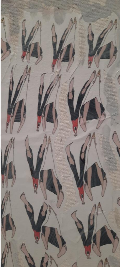
© aus der Ausstellung „Fröhlich sein“, Schirn Frankfurt)

sind; dass dazu Leben, Freiheit und das Streben nach Glück gehören“. Durch die